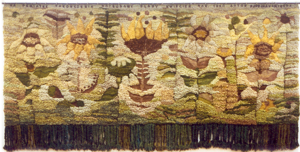
"Plant composition", 1979-1980, 137,8 x 82,7 inches, made for Toyobo Ltd., Osaka, Japan