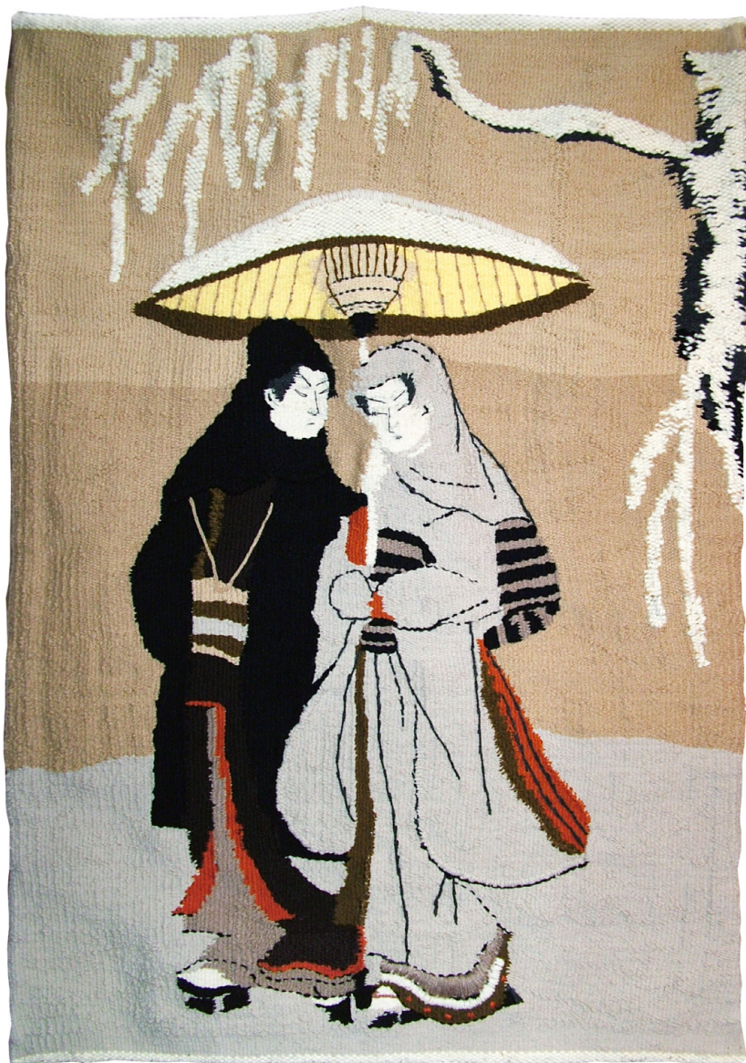
"Lovers in the snow storm according to Suzuki Harunobu" 2008. Tapestry. Natural wool. Size 36,2 x 59,6 inches. Hand made.

"Kochankowie w śnieżnej burzy wg. Suzuki Harunobu" 2008. Gobelin. Wełna naturalna. Wymiary 92x132 cm. Wykonany ręcznie.